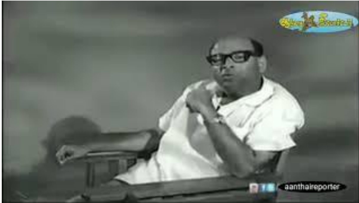
Filmmaker: Sundaram Balachander Jan. 18, 1927- Apr. 13, 1990